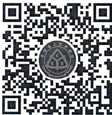
第十届电工技术前沿问题学术论坛